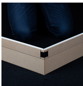
Lysninger kan limes og clipses sammen evt. 2 clips i hver side.

NIC Denmark anbefaler at man forsejler med fugemasse ned mod bundstykker/gulv for at undgå at MDF optager fugt. Det kan derfor anbefales at montere 12,5 mm notliste mod gulv, hvorefter man kan montere lysningspladen i denne sammen med fugemasse. I forbindelse med montage skal der fuges imellem alle åbne samlinger.