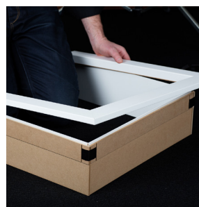
Flex gerigter monteres i flex not i lysningspladen kan evt. limes i.