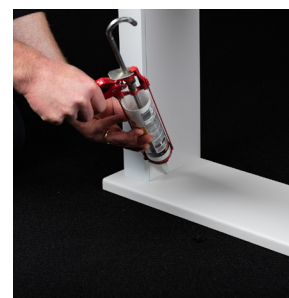
ClipOn InnerCore Flex lysning med flex gerigter monteres i vinduesnot kan evt. limes i.