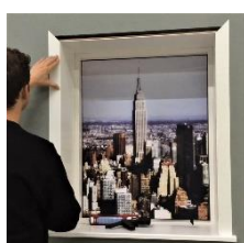
Monter Unique lister i lysningsnot.