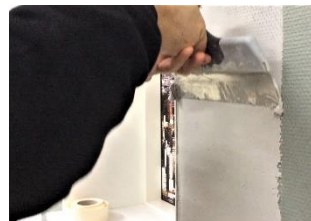
Påfør 1 mm spartelmasse