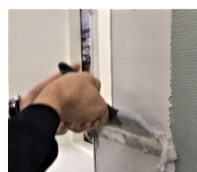
Skjul Unique listen med spartelmasse, der trækkes helt til spartelkant.