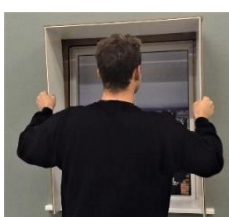
Brug evt. lim i vinduesnot og monter lysning heri.