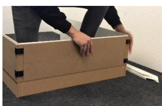
Lysninger limes og clipses.

Ved bestilling angives indvendige lysningsmål i dybde, bredde og højde. Lysningerne leveres som ClipOn InnerCore Unique 3- eller 4-sidet lysning med løs 60 mm Unique PVC-liste for spartling og 12 mm MDF, Fugtfast MDF eller EnergyLine lysningsplade. Armeringsbånd skal monteres ved overgang mellem Unique PVC-liste og mur. Ved opsætning skal der fuges mellem alle åbne samlinger.