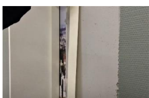
Monter armeringsbånd, i våd spartelmasse , mellem mur og hele Unique listen med overlap i hjørner.