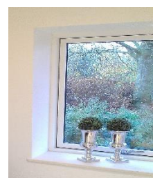
Det færdige resultat.