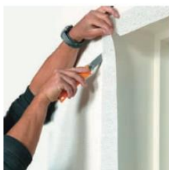
Væv/filt opsættes og skæres helt til den færdigbehandlede lysningskant og væggen males.