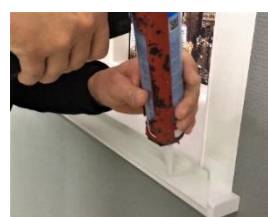
Påfør lim på bagsiden af Unique listen, så den limes mod væg.