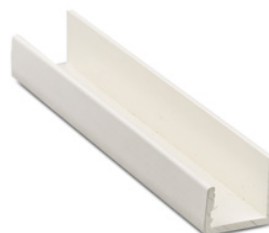
Bund og top notliste